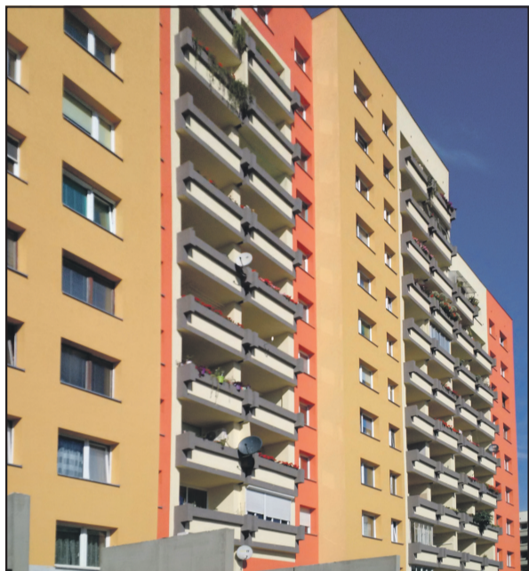
Ul. Balonowa 11-19 / Drzewieckiego 58-64.

Spółdzielnia w dalszym ciągu realizuje planowane remonty i modernizacje. Kontynuujemy wymianę pionów oraz poziomów instalacji wodnych w budynkach oraz wymieniamy częściowo instalację kanalizacyjną. Również prowadzone są prace związane z naprawą, czyszczeniem i udrażnianiem przewodów wentylacyjnych.