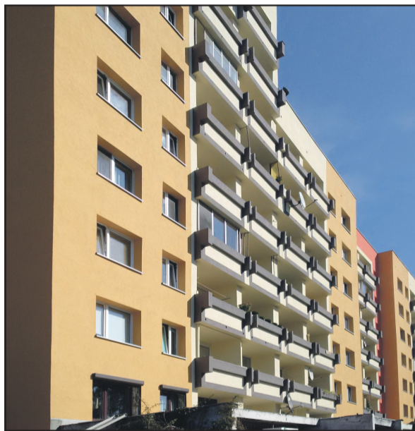
Ul. Balonowa 1–9 / Horbaczewskiego 65–73.

z działalności organów Spółdzielni, jak również – co najważniejsze – sprawozdania finansowego Spółdzielni. Ze swej strony, jako Zarząd – chcieliśmy Państwu podziękować za okazane zaufanie, jednocześnie jednak dostrzegamy, że część Członków Spółdzielni nie wyraziło aprobaty dla działań i kierunków podjętych przez Spółdzielnię. Wiemy, że zawsze jest miejsce do poprawy i w przyszłości będziemy się starać ze wszystkich sił, by wszyscy mieszkańcy naszej Spółdzielni byli zadowoleni z jej funkcjonowania.