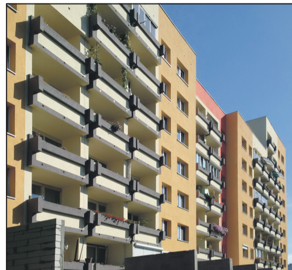
Ul. Balonowa 1-9 / Horbaczewskiego 65-73.

Na szczególną uwagę zasługują budynki przy placu Grunwaldzkim i Curie-Skłodowskiej. Kilka miesięcy temu ruszyły od lat oczekiwane remonty elewacji wraz z wykonaniem ocieplenia. Jako pierwszy został rozpoczęty remont budynku przy placu Grunwaldzkim 4, następnie budynku przy placu Grunwaldzkim 6A, obecnie zostały rozpoczęte prace na budynku przy placu Grunwaldzkim 8. Roboty przebiegają harmonijnie, aczkolwiek nie należą do łatwych i bezproblemowych.