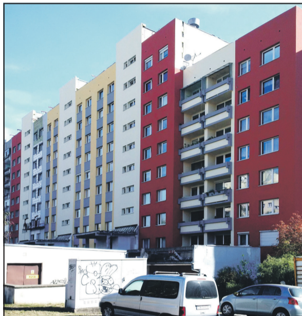
Ul. Drzewieckiego 4–12 / Szybowcowa 22–26.