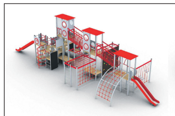
POLANA REKREACYJNA KOSMONAUTÓW (PROJEKT 788)